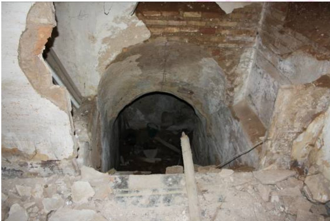
Vista de escaleras de acceso al sótano y galería subterránea.

PLAZA DE ESPAÑA, 1 - 23740 ANDÚJAR (JAÉN)