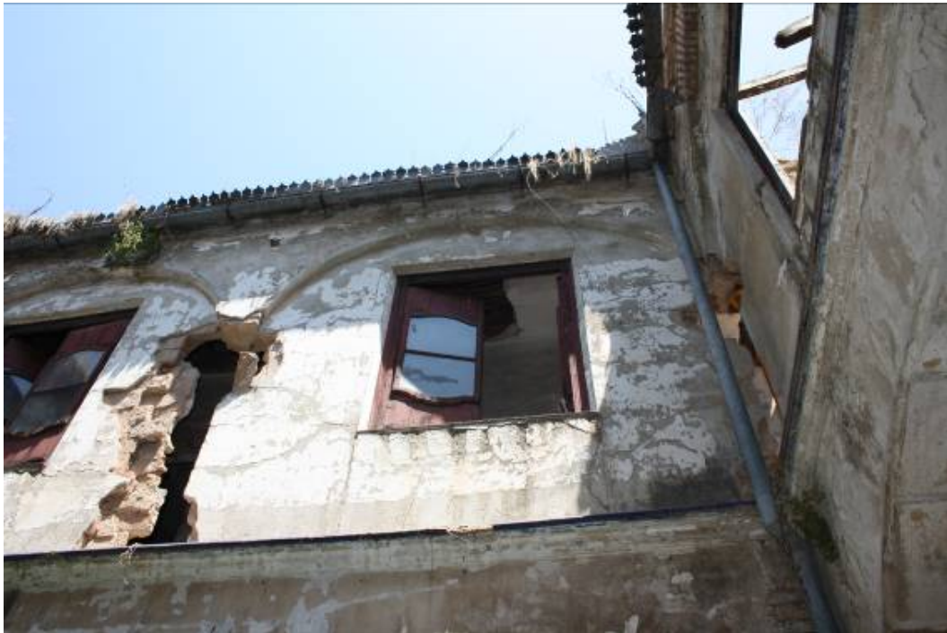
Detalle de Sustracción de pilastras del patio interior