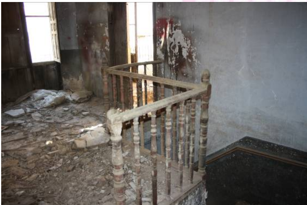
Detalle de balaustrada de madera

PLAZA DE ESPAÑA, 1 - 23740 ANDÚJAR (JAÉN)