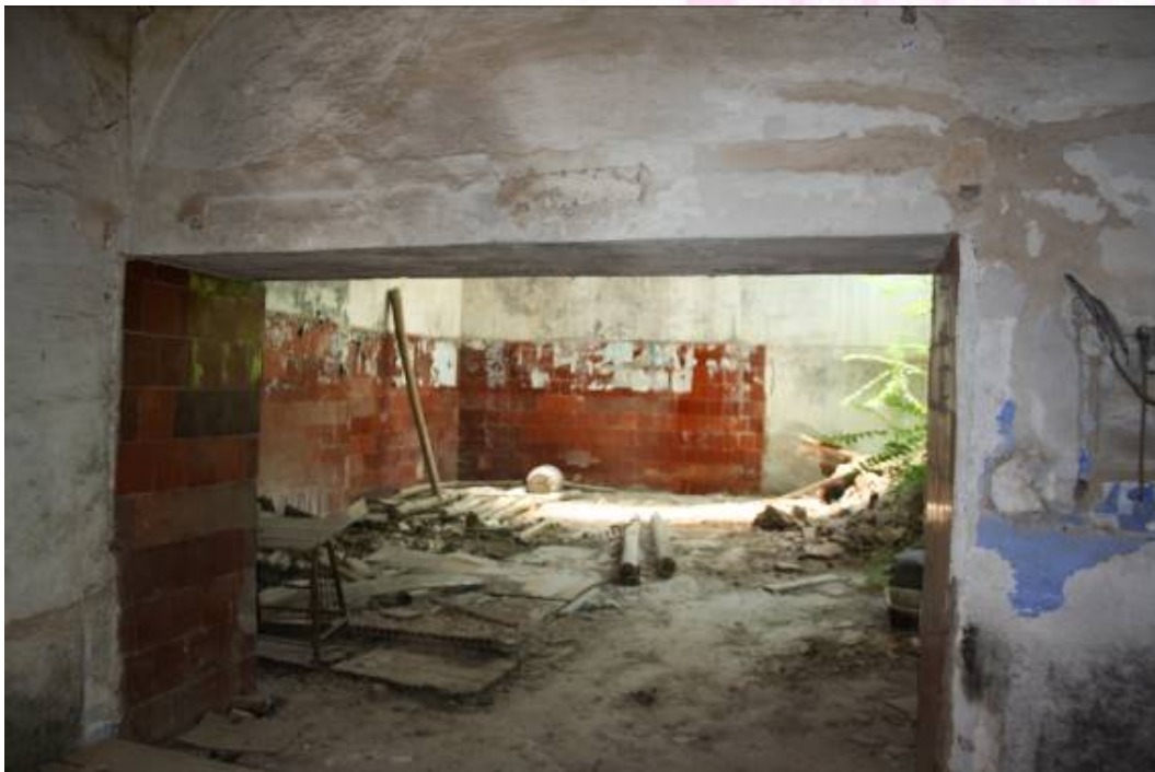
Vista interior de la parte destinada al molino de aceite

PLAZA DE ESPAÑA, 1 - 23740 ANDÚJAR (JAÉN)