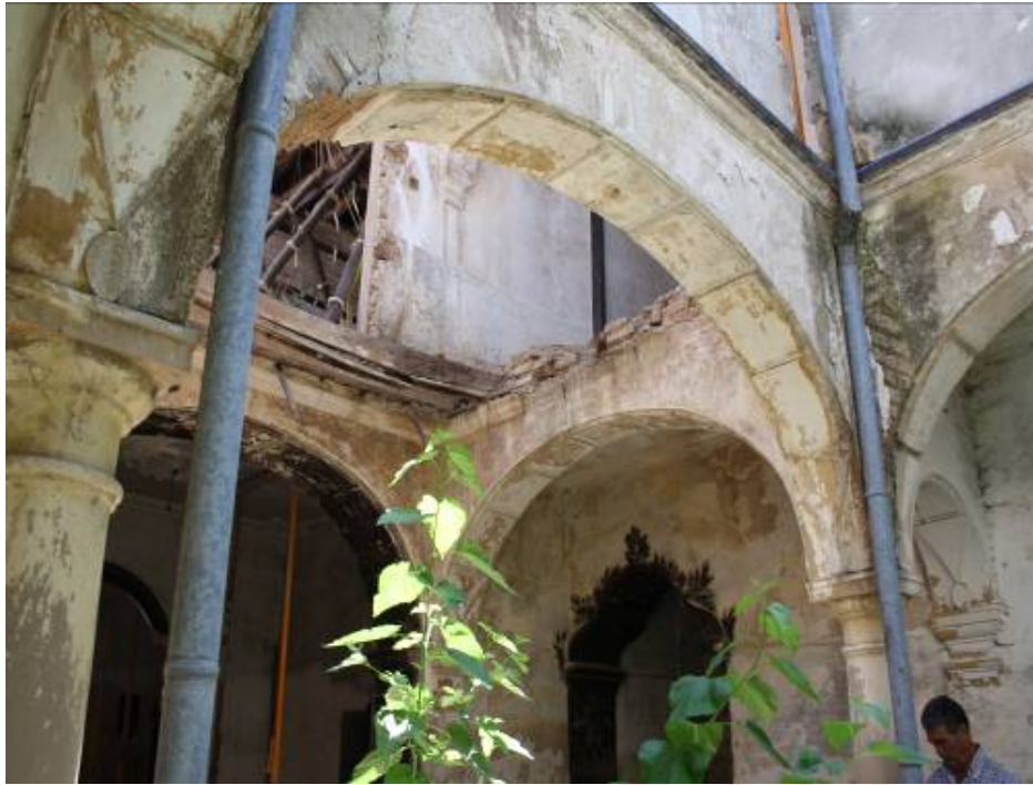
Vista de arcadas del patio central