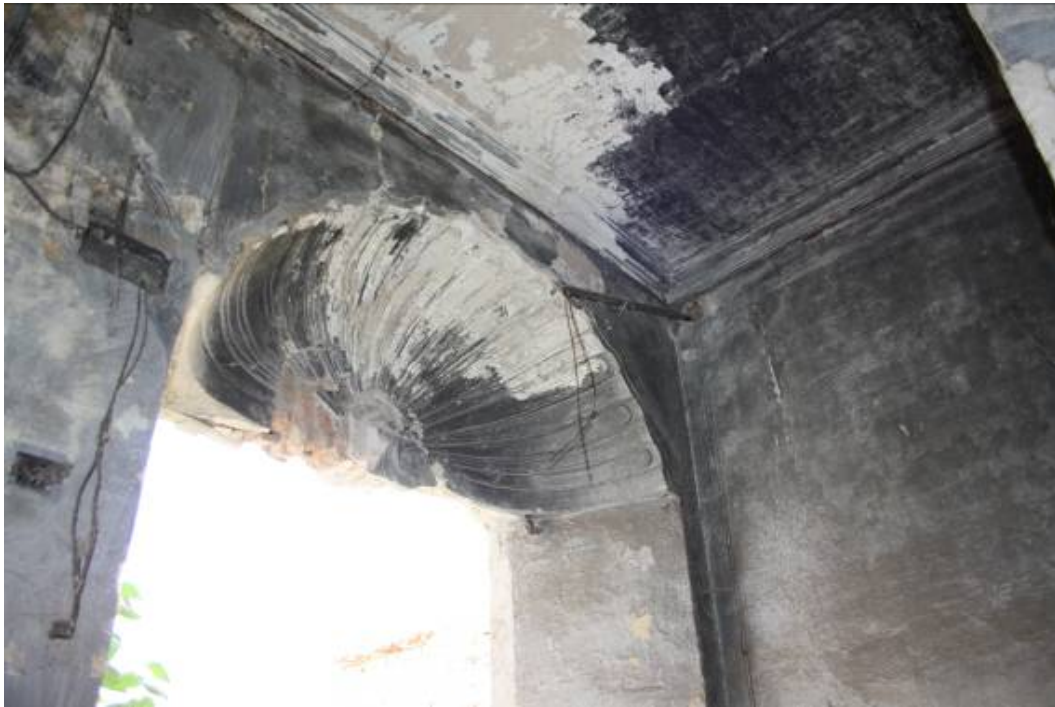
Detalle de revoco realizado en huecos de ventanas