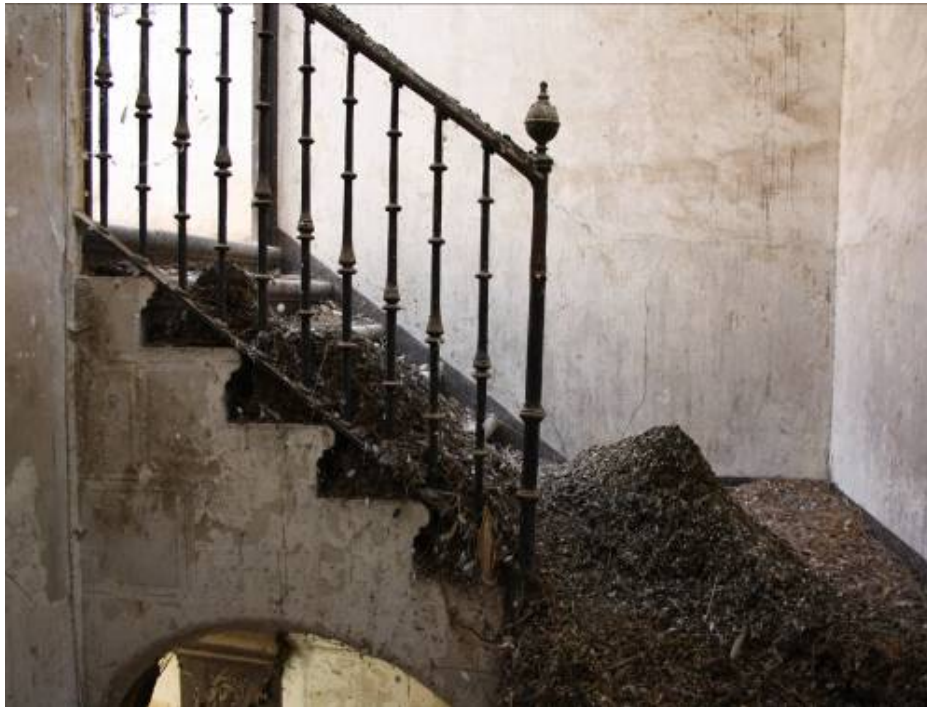
Vista lateral de la escalera principal