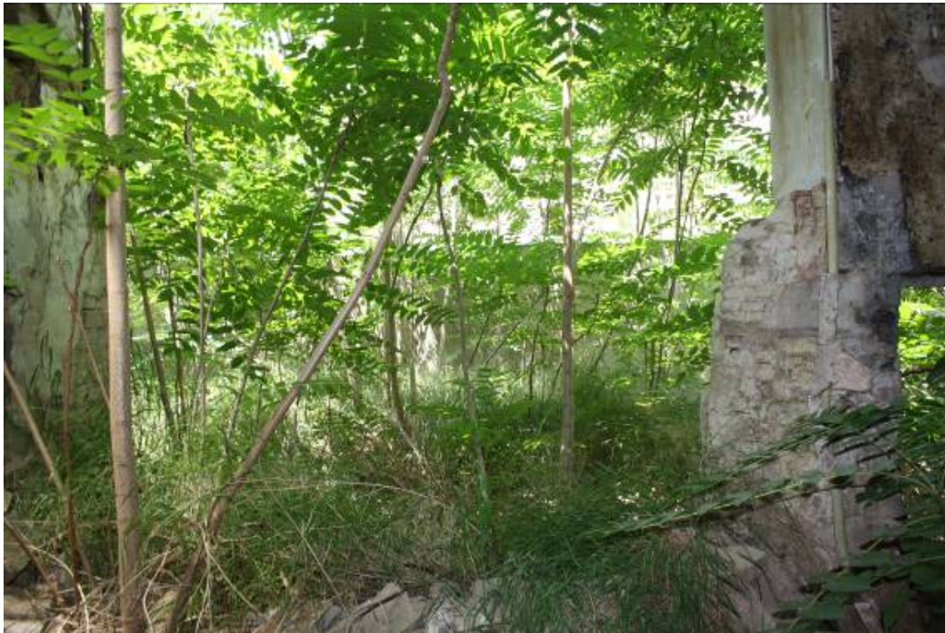
Detalle de vegetación descontrolada en patio trasero.