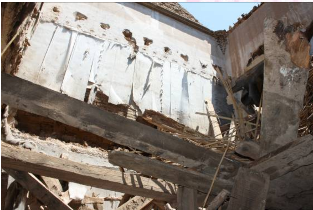
Vista de la primera crujía del palacio totalmente derrumbada.

PLAZA DE ESPAÑA, 1 - 23740 ANDÚJAR (JAÉN)