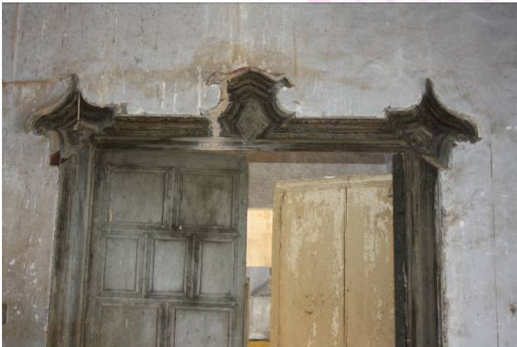
Detalle de carpintería de madera en puertas.

PLAZA DE ESPAÑA, 1 - 23740 ANDÚJAR (JAÉN)