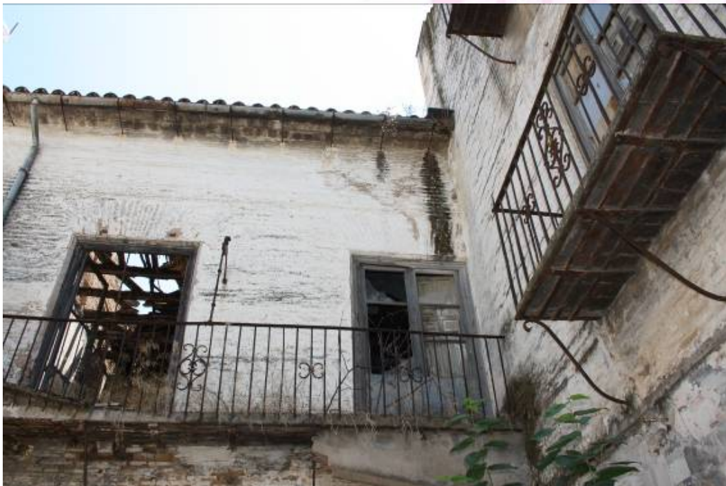
Fachada Trasera del Palacio junto a Torreón.

PLAZA DE ESPAÑA, 1 - 23740 ANDÚJAR (JAÉN)