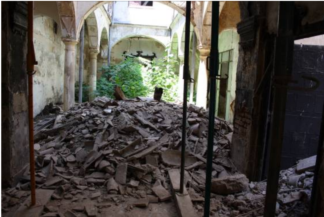
Vista del patio central desde el hall de entrada.