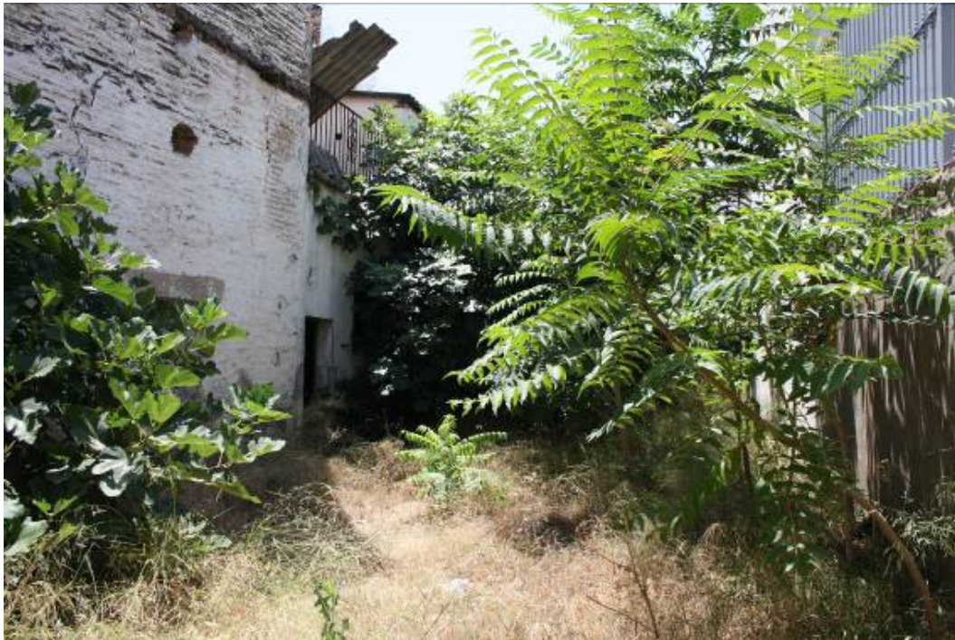
Vista del Patio trasero.