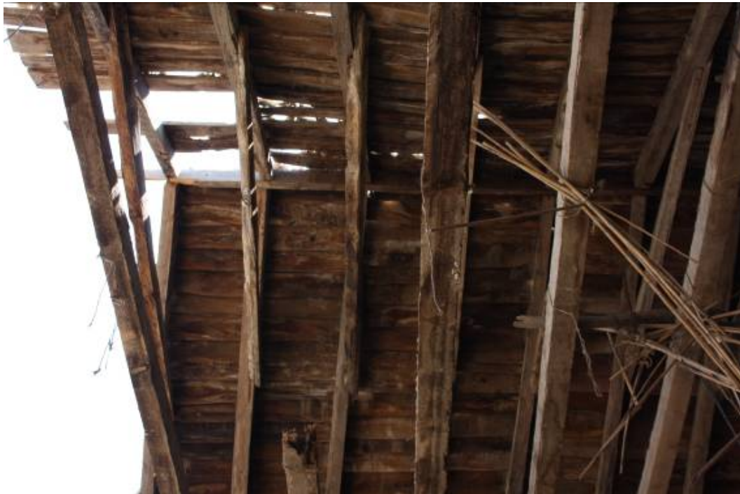
Vista de cubierta derrumbada.