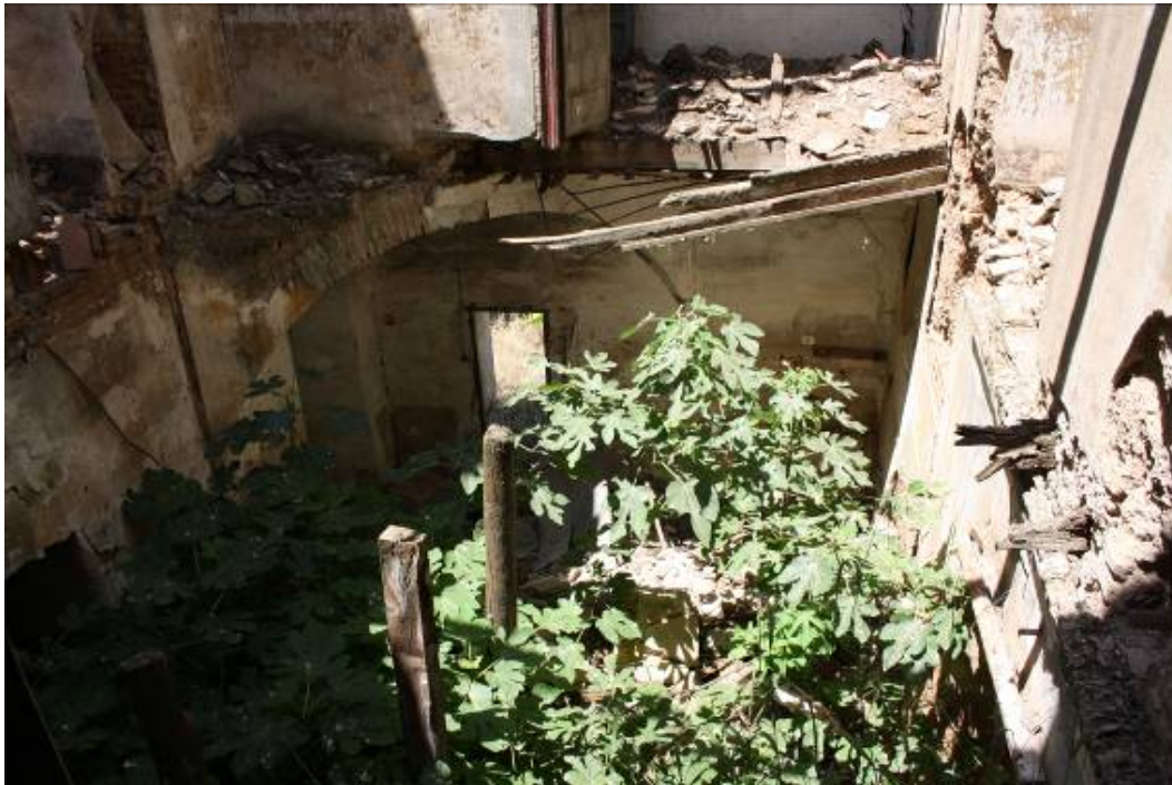
Vista superior del interior del torreón