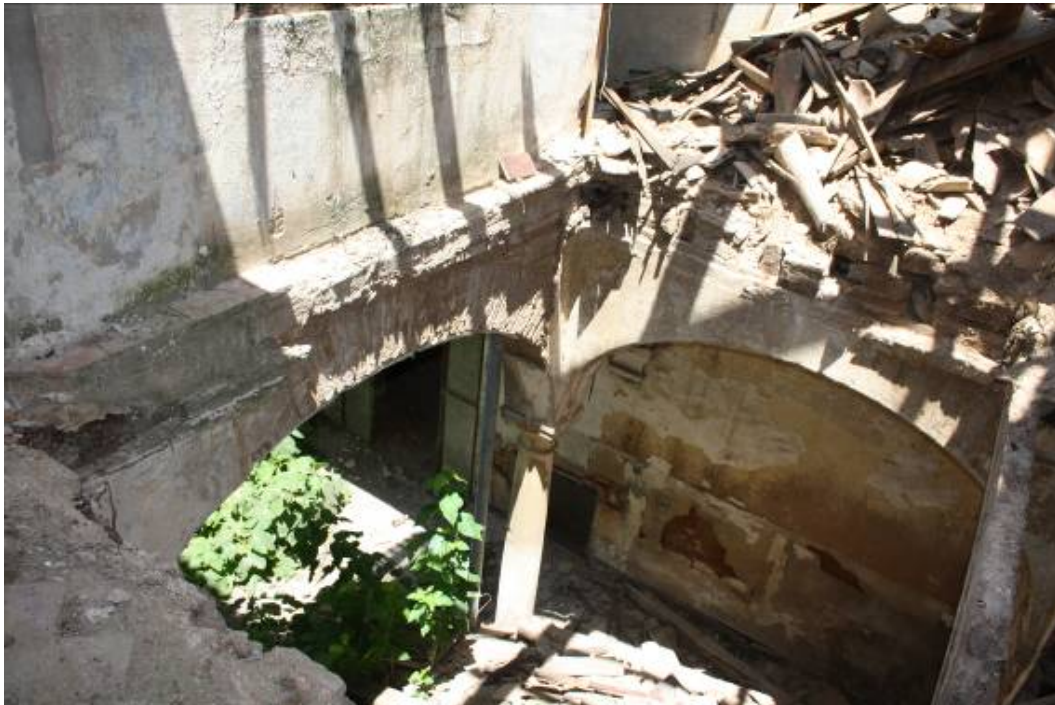
Vista superior del patio interior.