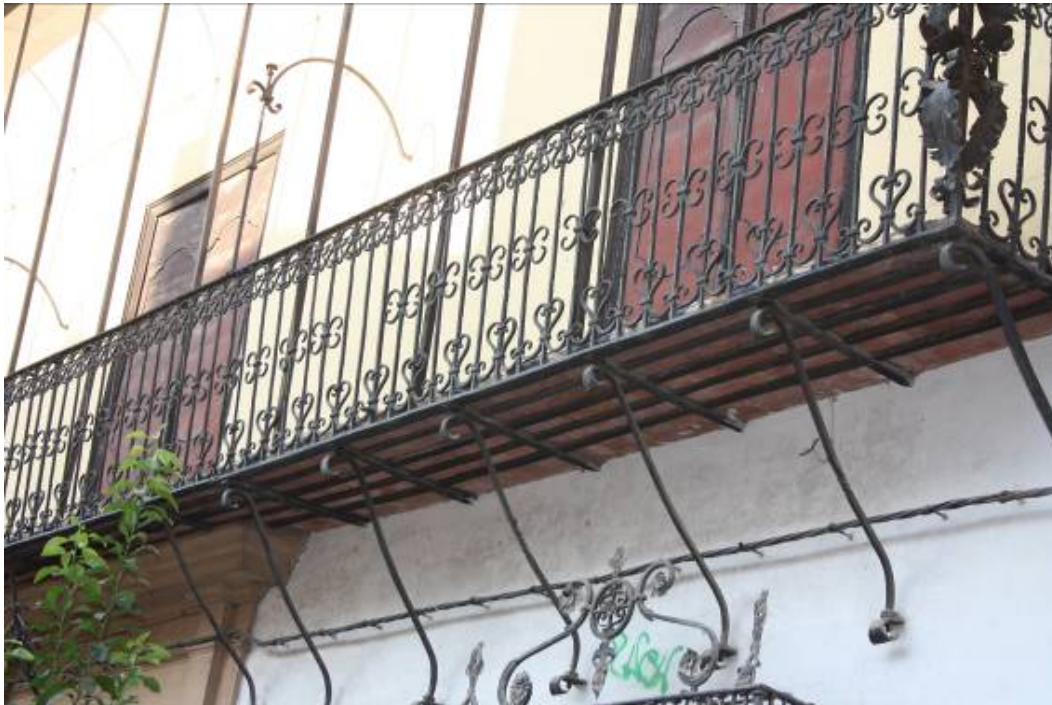
Vista de la balconada exterior

Posterior a la realización de estas fotos el Ayuntamiento ha realizado labores de limpieza y estabilización en el edificio, por lo que pueden existir pequeñas diferencias con la actualidad.