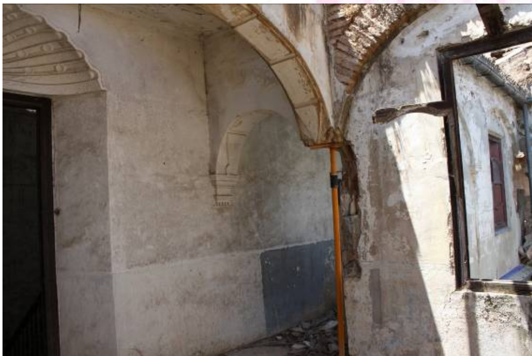
Detalle de apuntalamiento por sustracción de pilastra de patio interior.

PLAZA DE ESPAÑA, 1 - 23740 ANDÚJAR (JAÉN)