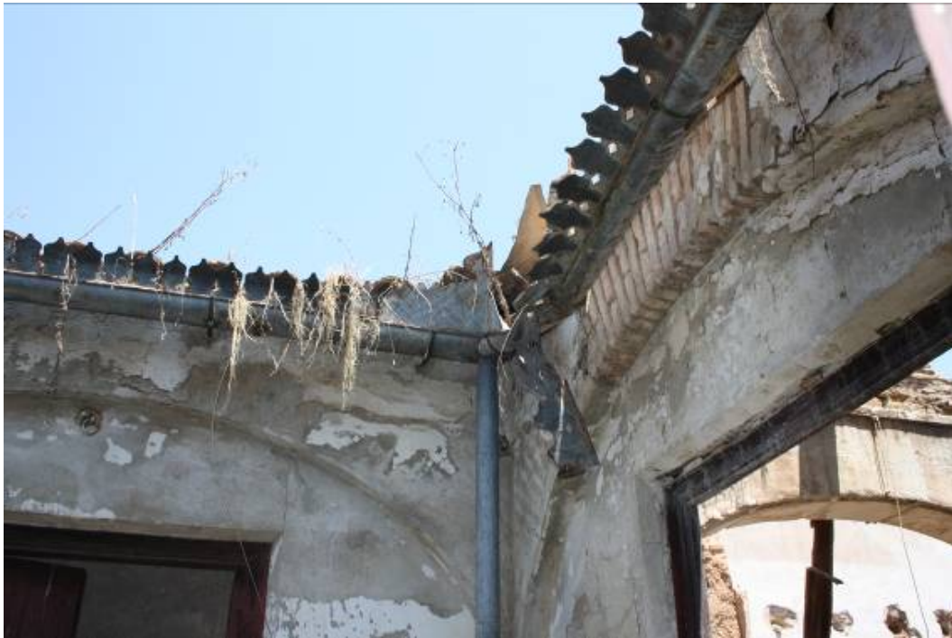
Detalle de canalón de acero galvanizado.