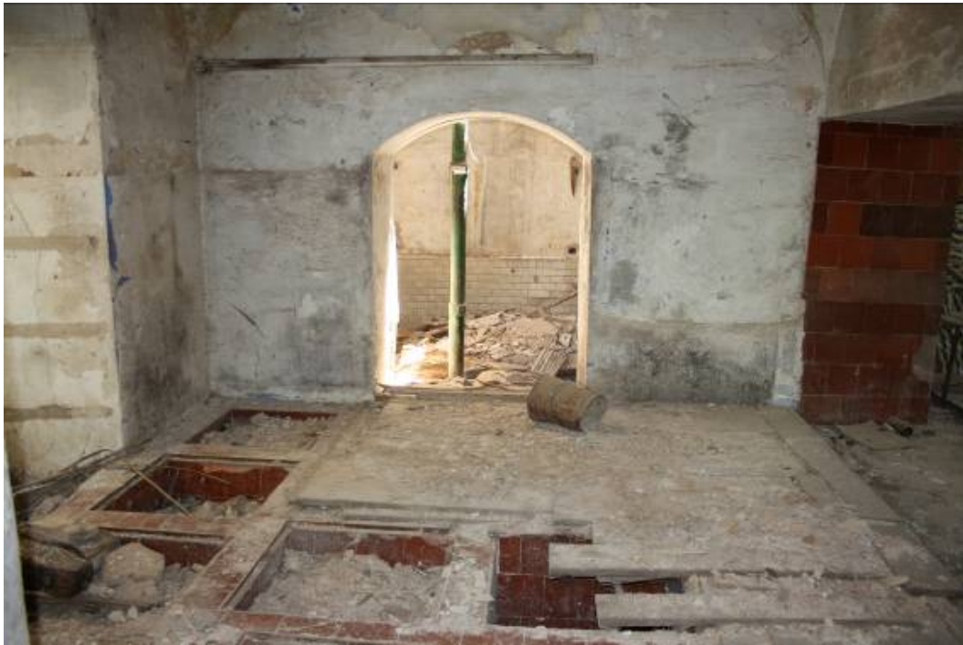
Vista interior de la almazara de aceite