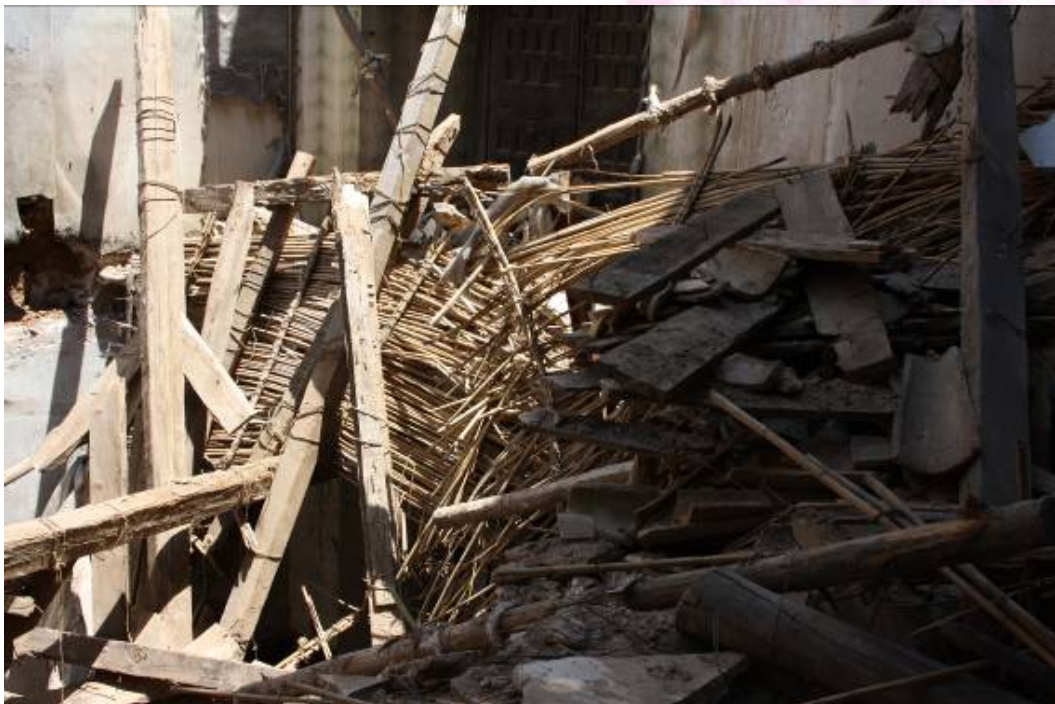
Detalle de acumulación de escombros.

PLAZA DE ESPAÑA, 1 - 23740 ANDÚJAR (JAÉN)