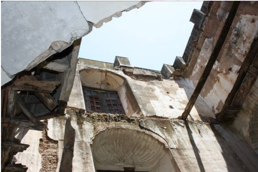
Vista interior del Torreón

PLAZA DE ESPAÑA, 1 - 23740 ANDÚJAR (JAÉN)