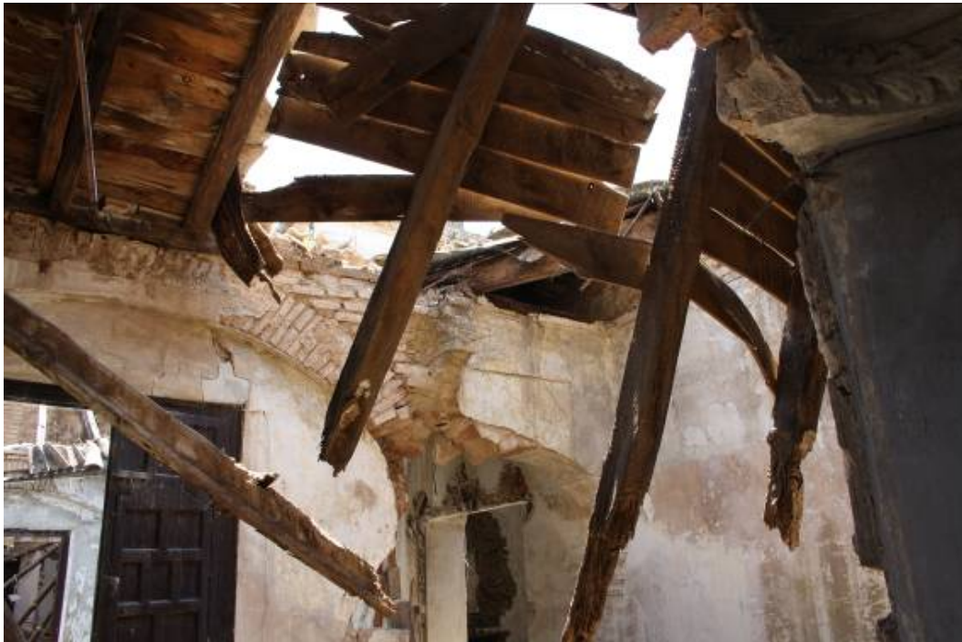
Vista interior del palacio.