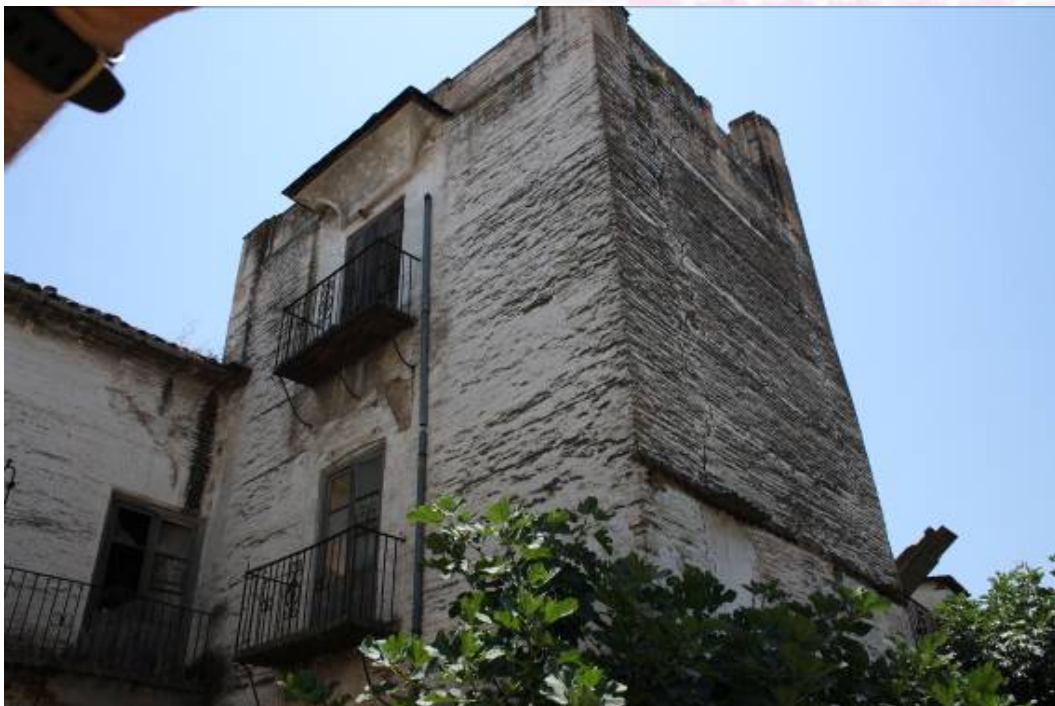
Vista del Torreón trasero de 3 alturas

PLAZA DE ESPAÑA, 1 - 23740 ANDÚJAR (JAÉN)