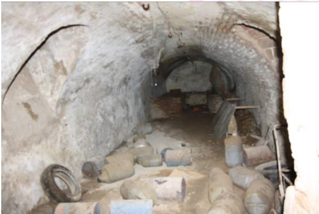
Vista interior del sótano.

PLAZA DE ESPAÑA, 1 - 23740 ANDÚJAR (JAÉN)