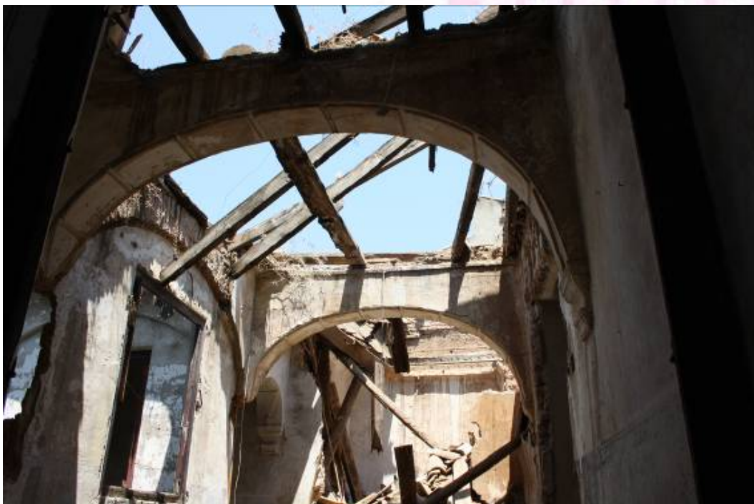
Vista de cubierta derrumbada.

PLAZA DE ESPAÑA, 1 - 23740 ANDÚJAR (JAÉN)