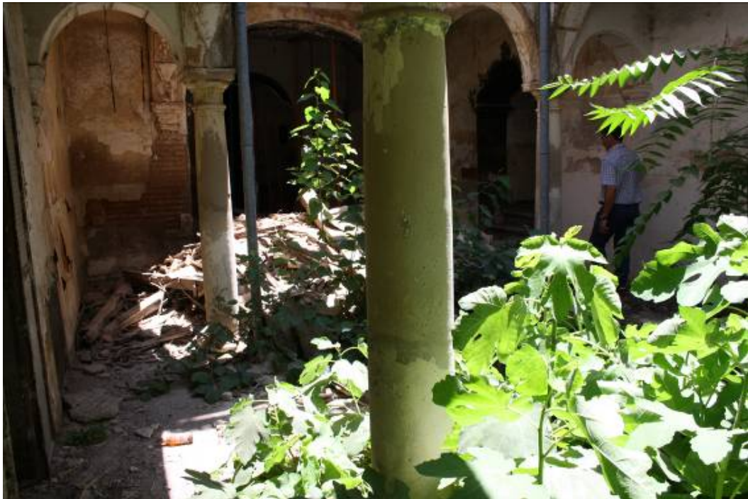
Vista del patio interior