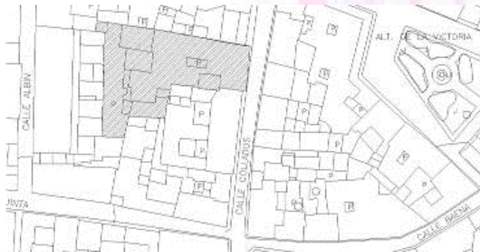
Fig. 1.- Emplazamiento de la casa Palacio del Ecijano.

El inmueble se encuentra ubicado en la c/ Colladas, nº22 de Andújar.