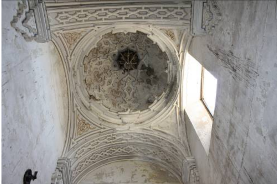
Vista de la Cúpula de la Escalera

PLAZA DE ESPAÑA, 1 - 23740 ANDÚJAR (JAÉN)