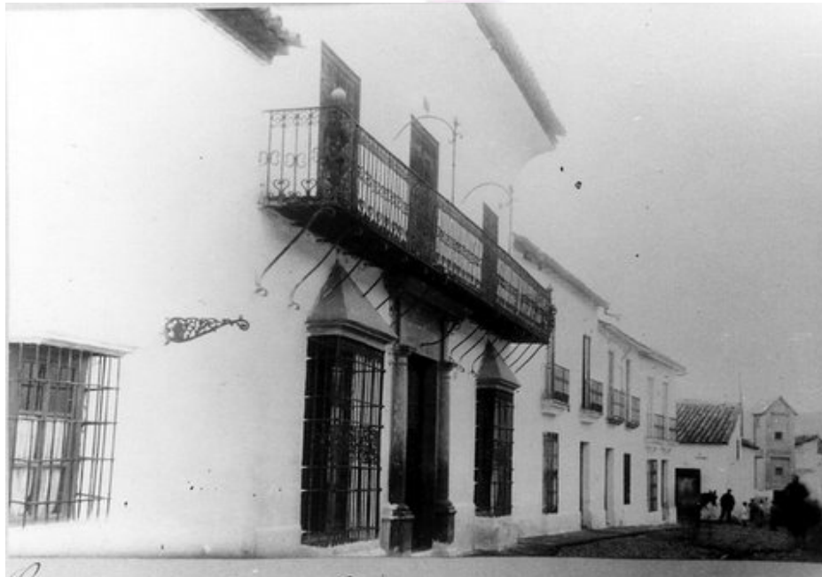
Fotografía de principios del s.XX de la Fachada de c/ Colladas

Existen elementos mínimos a proteger, como son la techumbre situada en la escalera, los azulejos situados en habitación en planta baja, columnas en patio, yeserías en recercados de huecos interiores, carpinterías de madera y cerrajerías y balconada exterior en c/ Colladas.