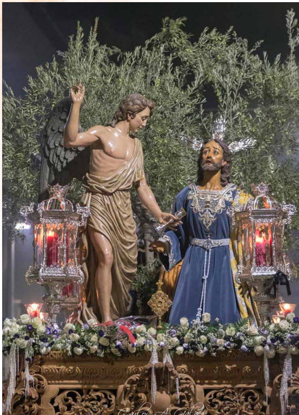
Nuestro Padre Jesús en su Agonía en el Huerto