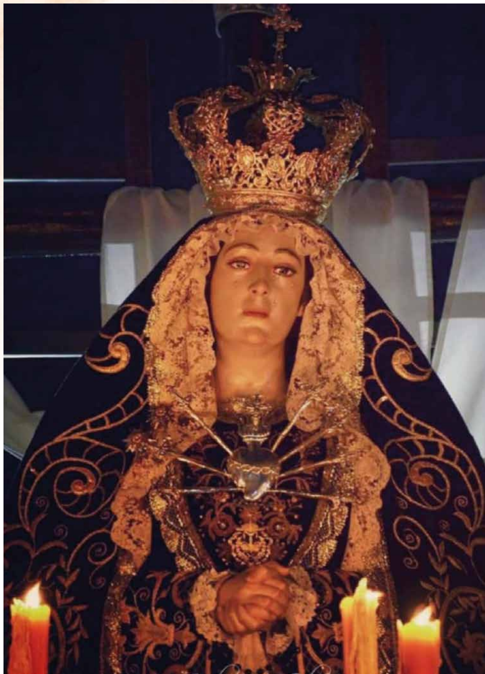
Ntra. Sra. De la Victoria en su Soledad