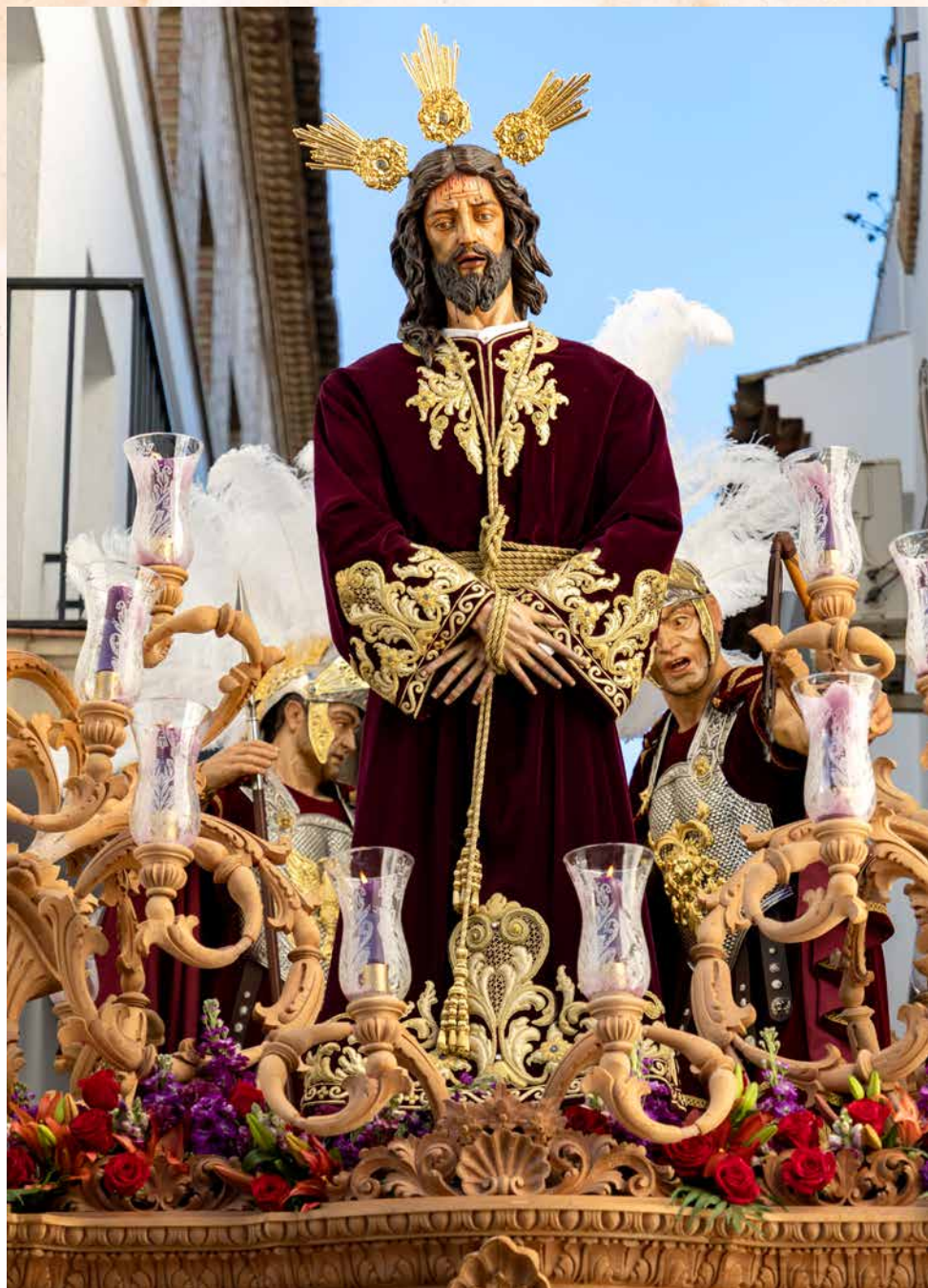
Nuestro Padre Jesús de la Sentencia