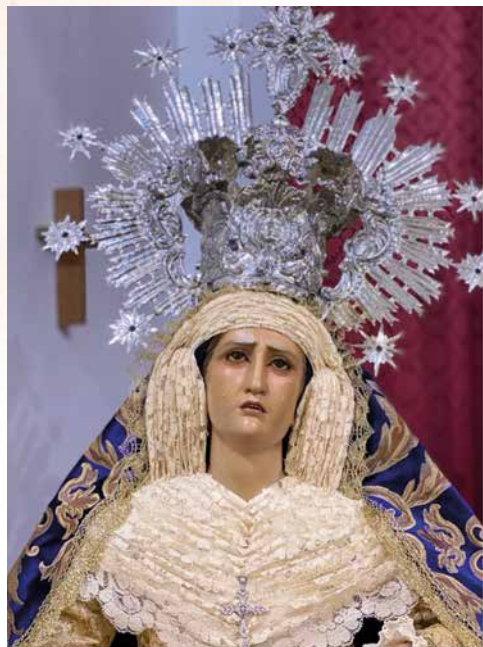
Nuestra Señora de los Dolores