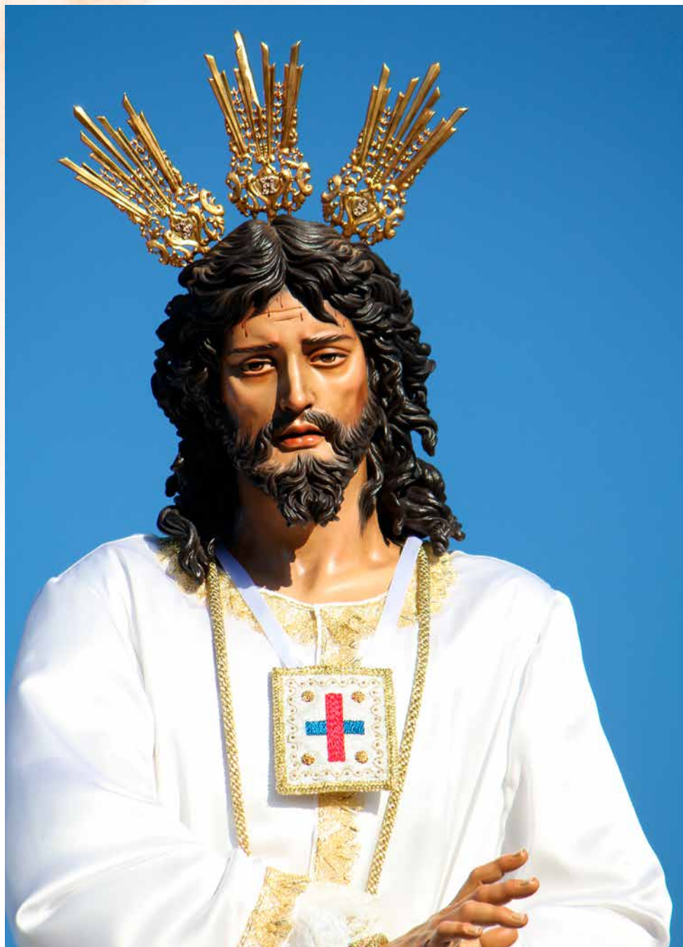
Jesús Cautivo de Sierra Morena