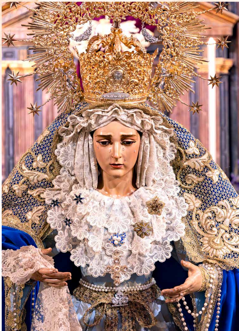
María Santísima del Buen Remedio