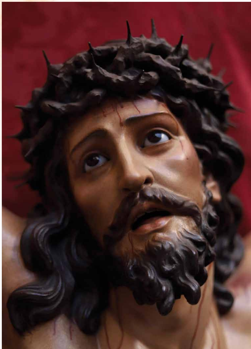
Cristo de la Expiración