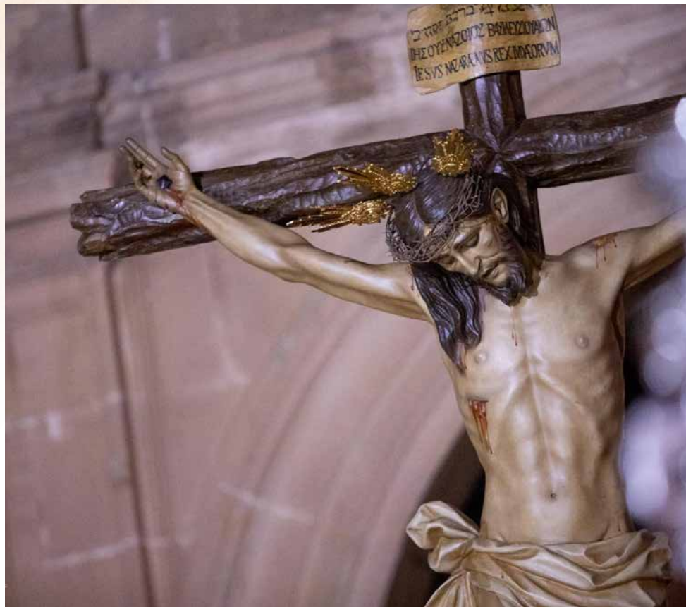
Santísimo Cristo de la Providencia

DATOS DE INTERÉS: Se recomienda contemplar el tránsito del cortejo procesional por algunos de los rincones más bellos de nuestra ciudad, algunos de ellos únicos en el recorrido usual de nuestras hermandades de pasión, como su paso por la Antigua Iglesia de Santiago o por el Altozano Arzobispo José Manuel Estepa. Y, por supuesto, su discurrir por la C/ Alhóndiga, donde se celebra una estación ante la hornacina que da testimonio de la devoción que despierta el Santísimo Cristo de la Providencia desde hace siglos entre el pueblo de Andújar.