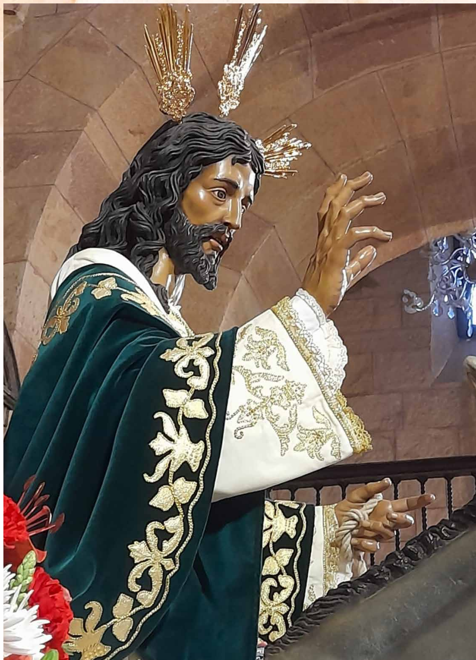
Nuestro Señor de La Paz en su entrada triunfal en Jerusalén