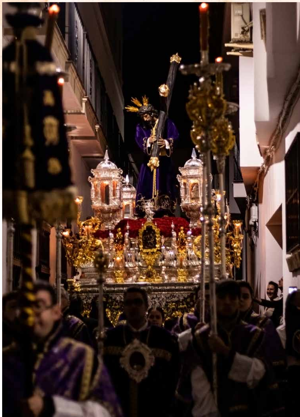
El Señor del Gran Poder a su paso por calle Carmen.