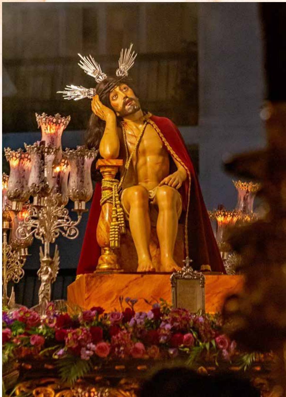
Nuestro Padre Jesús de La Paciencia