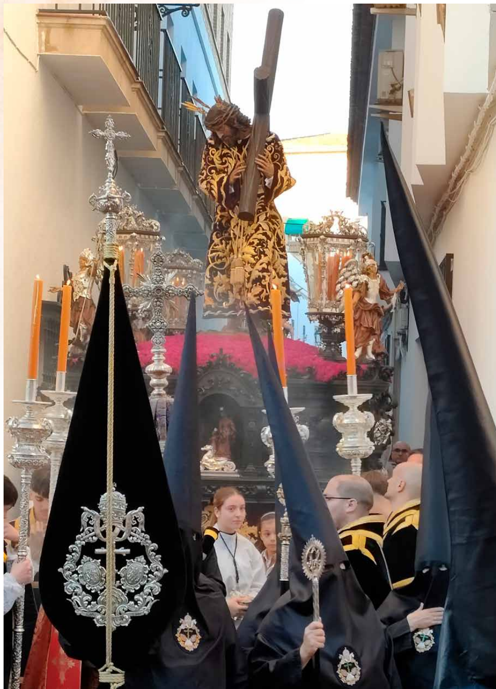
Nuestro Padre Jesús Nazareno