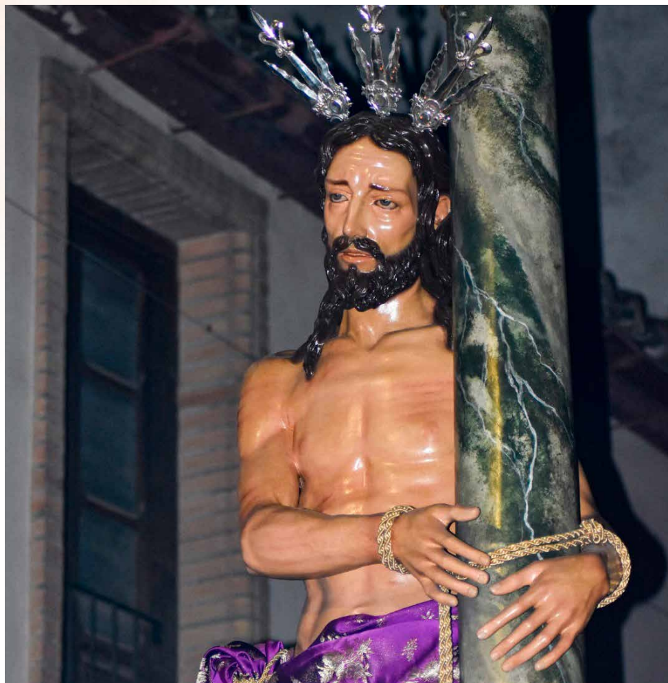
Ntro. Padre Jesús atado a la columna