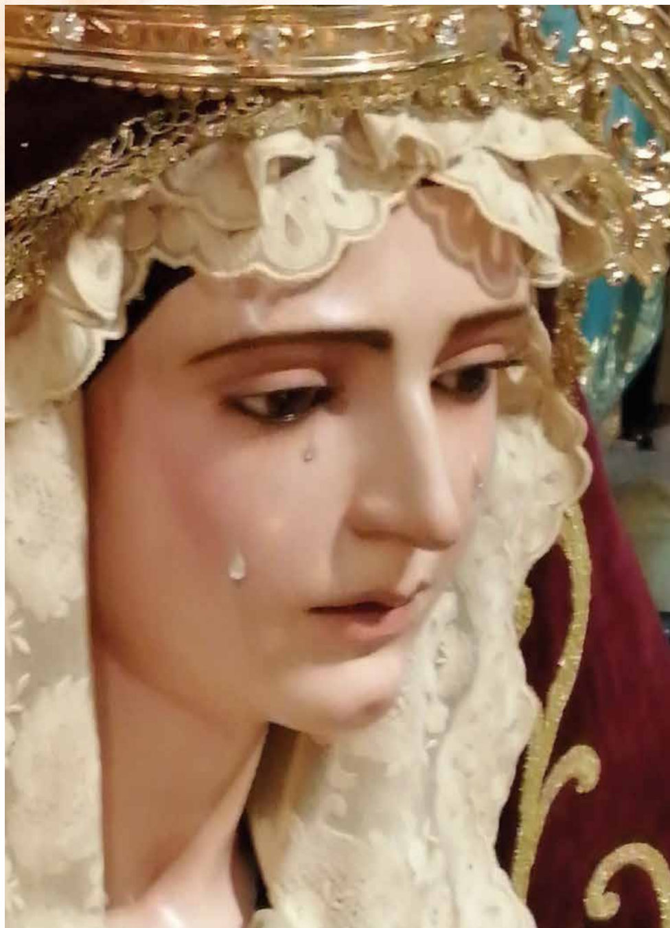
Ntra. Señora de la Amargura