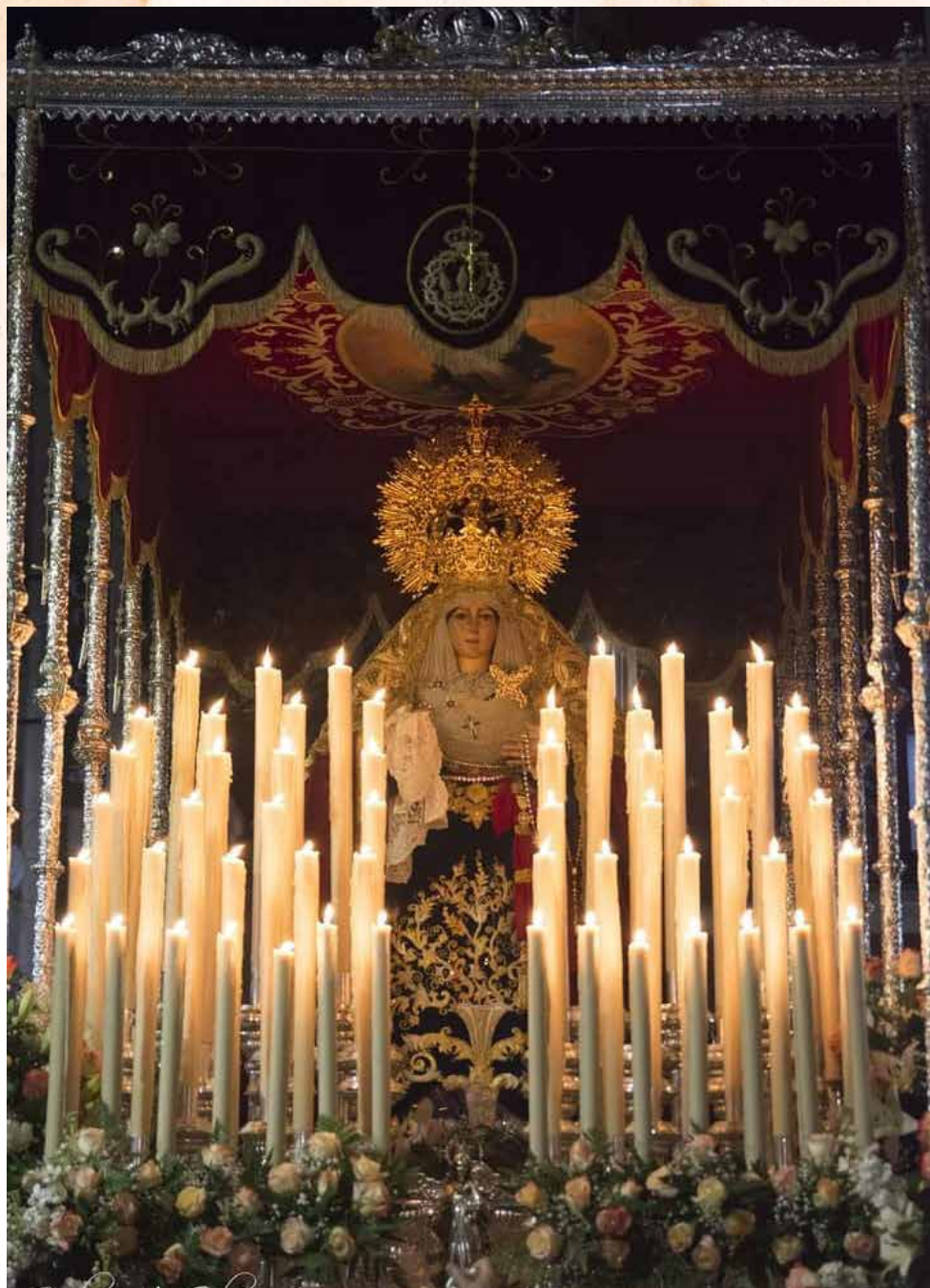
Nuestra Señora del Rosario