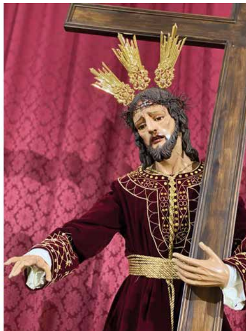
Ntro. Padre Jesús de la Salud