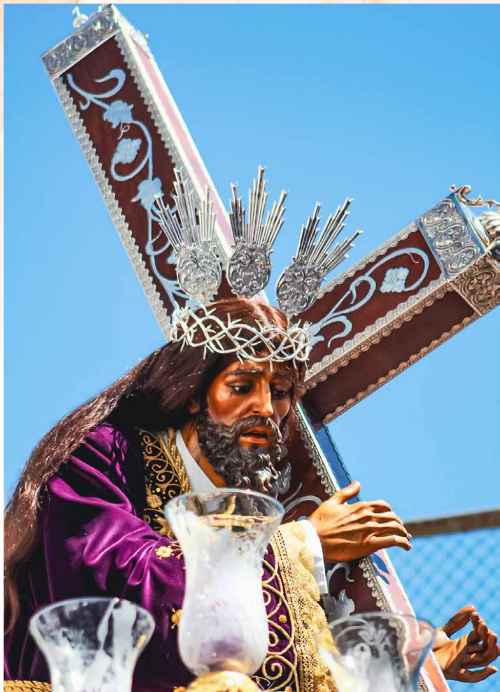
Ntro. Padre Jesús Nazareno "Señor de los Señores"