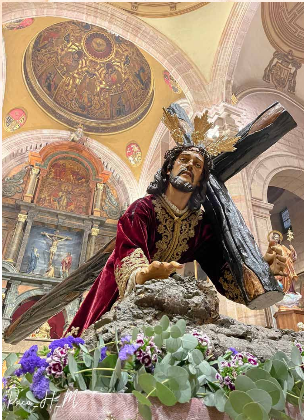
Ntro. Padre Jesús Caído