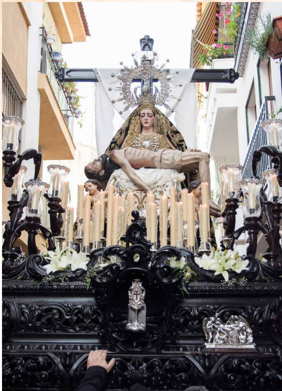
Ntra. Sra. de las Angustias