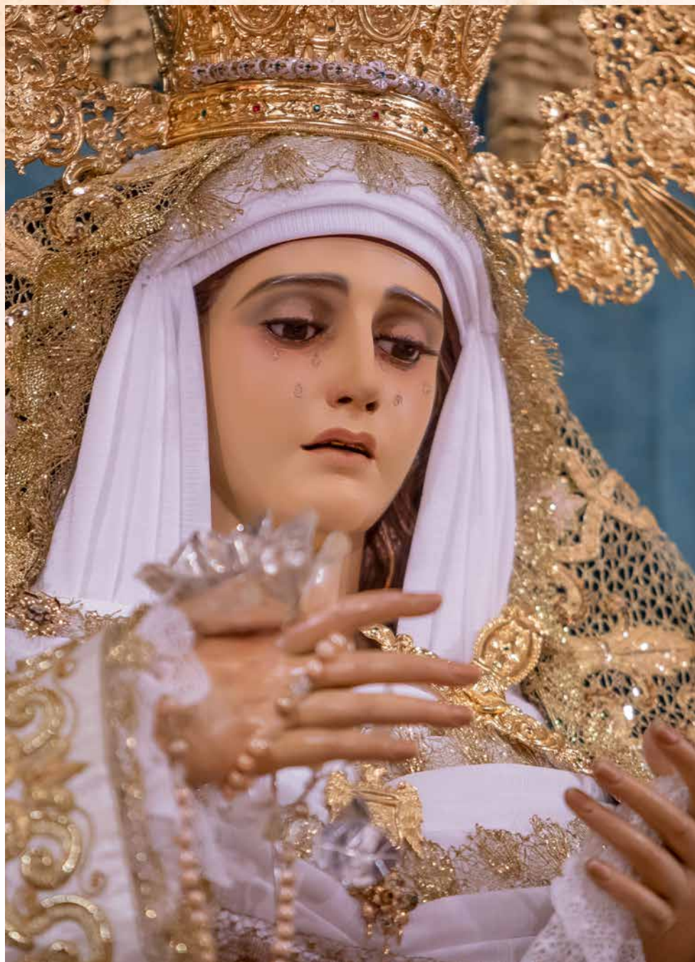
Ntra. Señora de la Esperanza