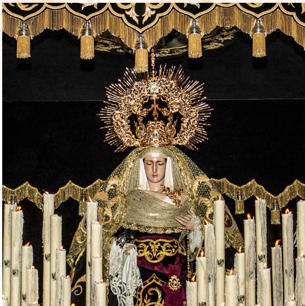
Ntra. Señora de los Dolores

MÚSICA: Agrupación Musical Nuestro Padre Jesús de la Piedad en su Presentación al Pueblo "La Estrella" de Jaén, tras el Paso de Misterio, y la Asociación Musical "Maestro Amador" de Andújar (Jaén), tras el Palio.